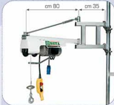
- TARTÓ ALKALMAZÁSA - Example of application - Exemple d'application - Anwendungsbeispiele - Ejemplo de aplicación