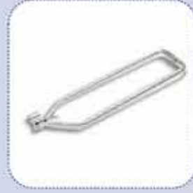
cod. 9223816600 - ALSÓ MEGTÁMASZTÓ - Lower support - Support inférieur - Untere Abstützung - Soporte inferior