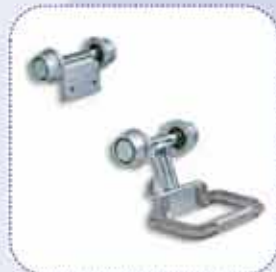
cod. 5439243101 - FUTÓMACSKA - Kit Wheels - Kit Galets - Rollensatz - Set carro