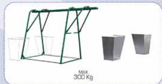
cod. 9200810600 - PORTÁL-DARU - Trestle - Chevalet - Traggerüst - Caballete