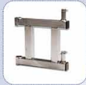
cod. 1616519800 - 35 cm TARTÓ - Parallelogram - Parallélogramme - Parallelogramm - Paralelograma