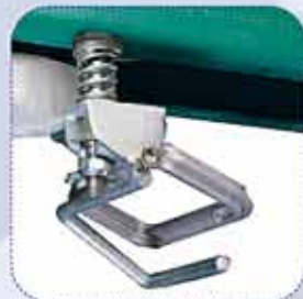
cod. 5439243102 - FÉK - Parking brake unit - Groupe frein de stat. - Feststellbremse - Freno de estacionamiento