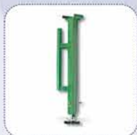
cod. 0007400000 - ABLAKDARU - Window strut - Chevron fenêtre - Fensterstütze - Puntal a ventana