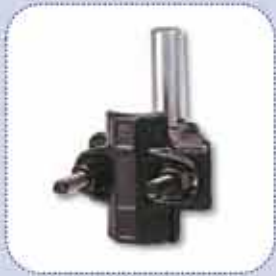
cod. 0007200000 - CSŐBILINCS - Fixing clamp - Collier de fixation - Klemme - Mordaza/Enlace sobresaliente