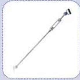
cod. S150-S4000 - MENETES FESZÍTŐ - Support with tie rod - Support à tirant - Zugstangenstütze - Tirante Unificado