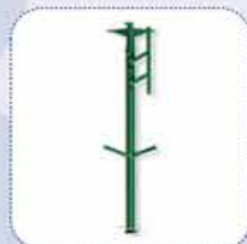
cod. 0007300000 - TELESZKÓPOS FÖDÉMDARU - Window strut - Chevron fenetre - Geschoß stütze - Puntal a techo